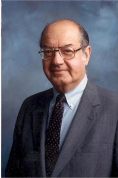
Paul Baran (USA) 1926-2011