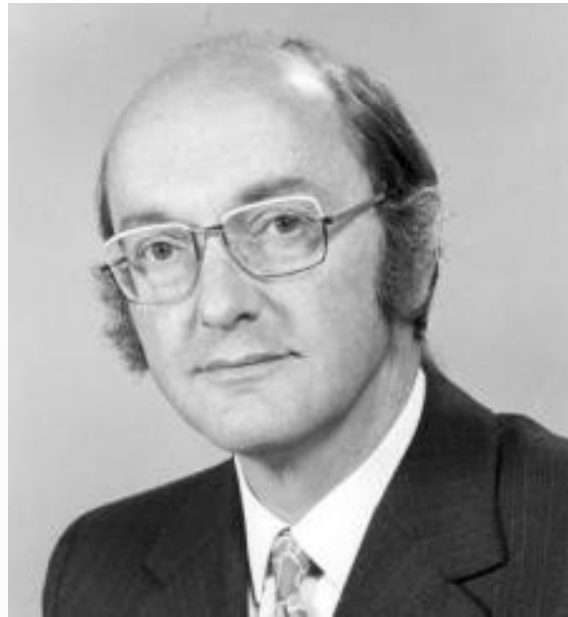
Donald Davies (ÜK) 1924-2000